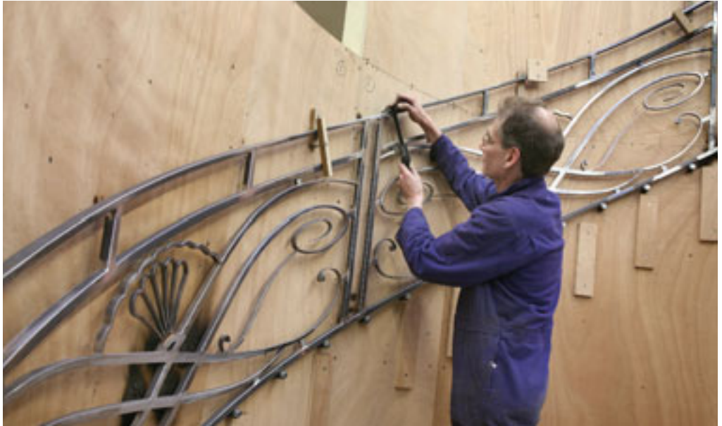
Met het hekwerk wordt heel omzichtig omgesprongen. Eigenlijk is het een kunstwerk wat hier straks de deur uitgaat.